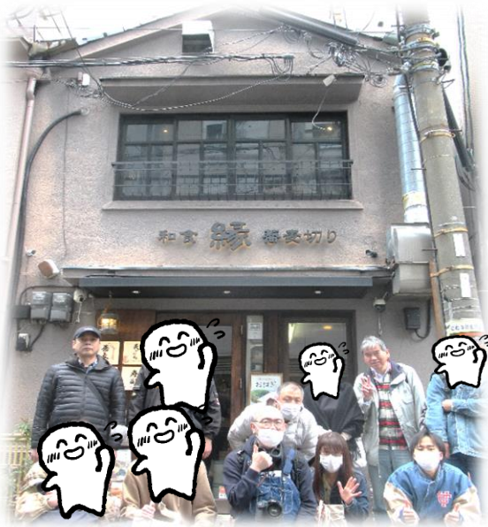
お店の前で集合写真を一枚☆